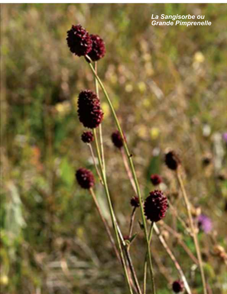
La Sangisorbe ou Grande Pimprenelle