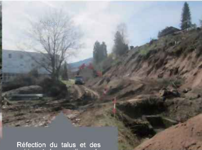
Réfection du talus et des voiries et réseaux divers de la rue du Rang de Veseaux.