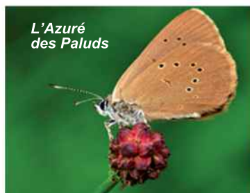
L' Azuré des Paluds