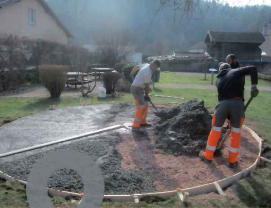
L'aire de jeux du presbytère à été rénovée au printemps