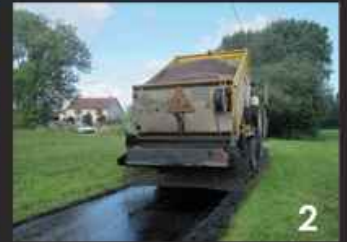
Préparation en enrobé à chaud des 30.000 m 2 en enduit monocouche. (2)