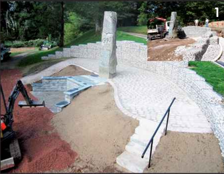
Travaux d'aménagement de la stèle de Noiregoux. (1)