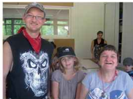
Rencontre entre les enfants du centre et les adultes du foyer Saphir

Depuis deux ans, le centre de loisirs de Saint-Nabord organise des rencontres avec le foyer « LE SAPHIR » basé à Ranfaing.