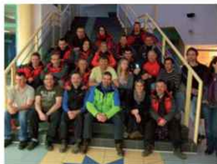
L'équipe des encadrants