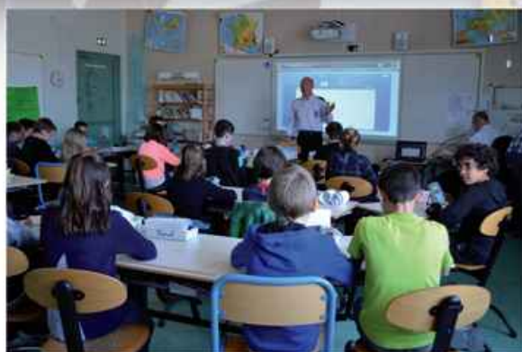
Quelques recommandations avant l'évaluation théorique.

Pour finir et afin que les petits Navoiriauds puissent rentrer chez eux et rejoindre leur domicile en toute sécurité, hiver comme été, la municipalité a décidé d'offrir des gilets jaunes homologués, à chacun d'entre eux.