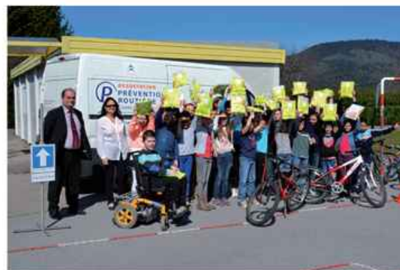
Distribution de gilets jaunes offerts par la mairie.