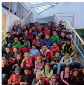
Les jeunes médaillés 2015